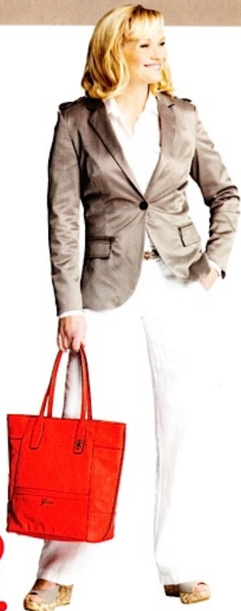
3. Mukavat pellavahousut & bleiseri