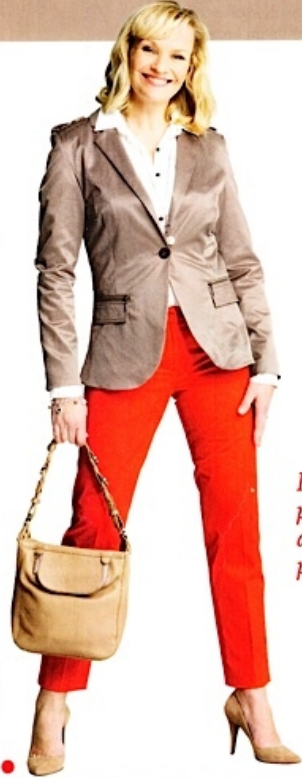
1. Muodikkaat kynähousut & bleiseri

bleiserin kanssa... ja valitsee seurakseen vauhdikkaita värejä.